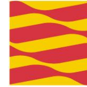
GOBIERNO DE ARAGON